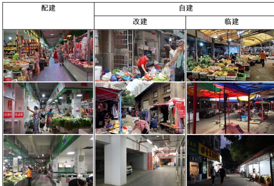
图 3 不同建设方式的菜市场实景图 Figure.3 Real Picture of Farmers' Market with Different Construction

135 开放小区型菜市场的改建最常采用的方式是改造社区住宅的一层空间，以形成若干单间商铺或整体连通形成综合性市场；除改建住宅空间外，社区非商业用途的独立用房和社区的出入口、停车位、宅间道路等交通空间以及宅间广场绿地也常成作为菜市场空间，被固定或临时性地占用，其中交通空间和广场绿地空间常为露天菜市场所在。商住区型菜市场主要以配建方式存在，常利用独立商业建筑的商铺空间，形成小型生鲜门店或大型生鲜超市。城中村型菜市场的临建通常是在城中村区域内改原有农田为大面积空地，于其上搭建钢架形成大棚或利用预制板材形成临时性棚户建筑，摊贩利用临时性建筑边界向街道延伸，形成露天菜市场。由此可以，对于不同类型的菜市场，形成活力的方式并不相同，开